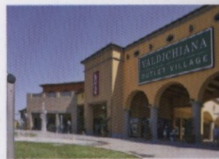
Portfolio / L'Outlet di Valdichiana

Comuni La mappa del do ut des immobiliare Dismissioni La Difesa libera le sue caserme Grazioli Il futuro del real estate è il riciclo H&M Scendiamo dal nord in cerca di province Atradius Perché ci piace il credit insurance Olimpiadi 2008 Come migliora il fisico di Pechino